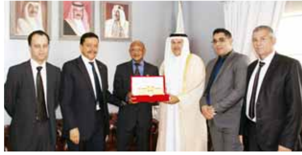
محافظ العاصمة يستقبل المسؤول الجزائري.