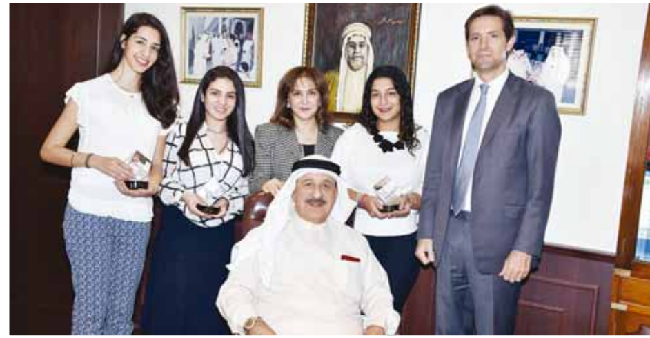
جانب من حفل تكريم أبناء كانو.