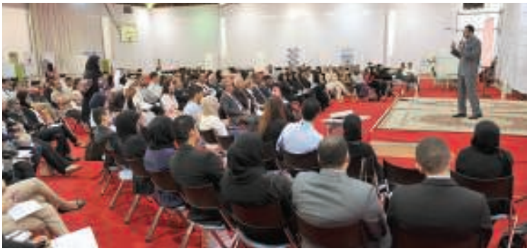
بعض فعاليات الملتقى

نظم مركز التدريب المهني والتوظيف بكلية البحرين التقنية (بوليتكنك البحرين) مؤخرًا «ملتقى توظيف الخريجين السنوي»، بحضور أكثر من خمسين ممثلًا عن مؤسسات وشركات القطاع الصناعي في المملكة بمختلف توجهاتها، حرصاً على تحقيق مكسب للطرفين: القطاع الصناعي والخريجين على حد سواء، حيث يمكن لأصحاب العمل أن يلتقوا بموظفين محتملين، فيما يمكن للطلبة أن يحصلوا على عروض مباشرة بالتعيين في وظائف في تلك الشركات.