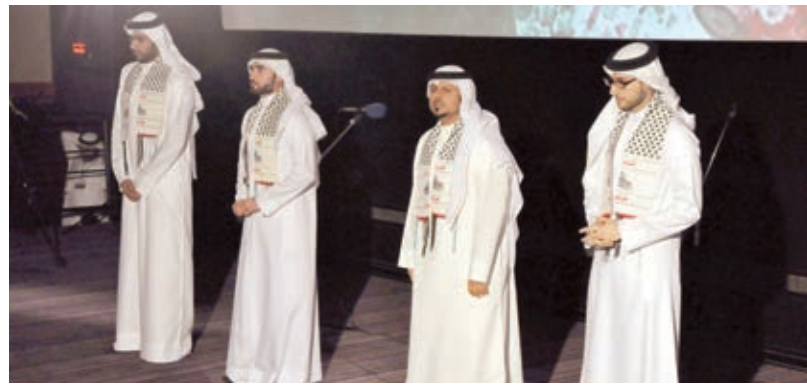
○ فرقة غنائية لفرقة أمواج البحرين.