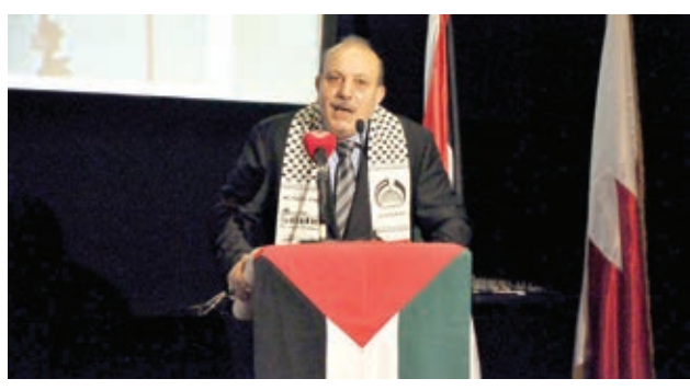
○ السفير الفلسطيني يلقي كلمة خلال أمسية «غزة تنتصر».

الضغوط الإسرائيلية والابتزاز الأمريكي الذين يرفضون الوحدة الفلسطينية، مضيفا أن الوحدة الفلسطينية هي وحدة دم أريق على كل ارض فلسطين، والشهداء الذين سقطوا من كل الفصائل الفلسطينية، وانه لا رجعة للقصة التي فيها الضعف ولكننا أبناء جلدة واحدة، ولا يعقل أن نتخلى عن إخواننا وأبناء جلدتنا لتقيم صلحا غير موجود على الأجدة الإسرائيلية، فهذا العدو غير جاهز لأي عملية سلام، فسياسته هي قتل الأطفال والنساء.