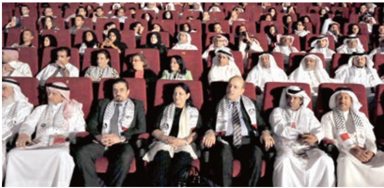
○ جانب من الحاضرين في الأمسية الشعرية.

وأوضح الوزير ان التطوير المستدام لإجراءات إصدار تراخيص البناء في المركز البلدي الشامل يعزز من جهود الدولة في استقطاب الاستثمارات في مجال التنمية العمرانية، حيث حافظت المملكة على المركز الأول عربيا والرابع عالميا في مجال إصدار تراخيص البناء وفقا لتقرير البنك الدولي لممارسة الأعمال لعام ٢٠١٤.