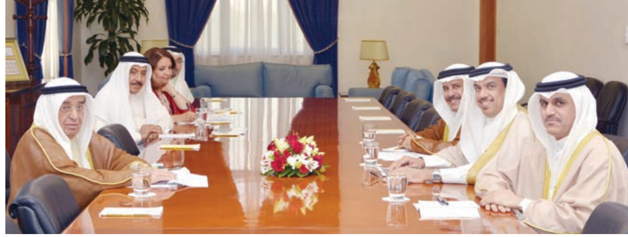
○ نائب رئيس الوزراء خلال اجتماعه مع وزير البلديات ومسؤولي البلديات.

استقبل سمو الشيخ محمد بن مبارك آل خليفة نائب رئيس مجلس الوزراء بمكتبه بقصر القضيبي أسس الدكتور جمعة بن أحمد الكعبي وزير شؤون البلديات والتخطيط العمراني يرافقه المهندس الشيخ محمد بن أحمد آل خليفة مدير عام بلدية المنامة والمهندس يوسف بن إبراهيم الغنم مدير عام بلدية الشمالية والمهندس وائل المبارك أمين عام هيئة التخطيط العمراني الذين قدموا لسموه عرضاً بشأن تقييم تجربة المجالس البلدية والتصورات المقترحة لتعظيم وتقديم الخدمات للمواطنين.