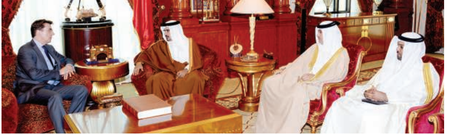
صاحب السمو الملكي ولي العهد خلال لقائه السفير البريطاني لدى البحرين أمس