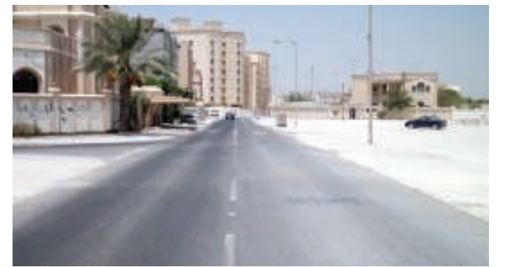
إعادة السفلتة على طريق 51