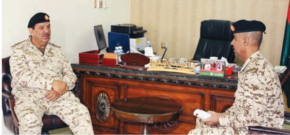
القائد العام يزور المجموعة القتالية.

غادرت البلاد فجر أمس الثلاثاء ١٦ فبراير ٢٠١٦م مجموعة القتال التابعة لقوة دفاع البحرين متجهة إلى مدينة الملك خالد العسكرية بمدينة حفر الباطن شمال المملكة العربية السعودية الشقيقة للمشاركة مع الدول الشقيقة والصديقة في المناورات العسكرية السعودية الأكبر في تاريخ المنطقة (رعد الشمال)، بمشاركة ٢٠ دولة عربية وإسلامية وصديقة لحماية الشعب الخليجي والعربي والإسلامي من أخطار الإرهاب، والاستعداد لمواجهة التحديات من التهديدات الإرهابية، وقد تحركت مجموعة القتال التابعة لقوة دفاع البحرين من مسكرها فجر أمس، وعبرت جسر الملك فهد متجهة إلى مواقعها في التمرين، بعد أن أنهت جميع استعداداتها وجهوزيتها القتالية والإدارية لتكون على أتم الاستعداد للمشاركة إلى جانب القوات الشقيقة بدول مجلس التعاون لدول الخليج العربية والصديقة، وذلك في جميع مراحل التمرين البرية والجوية، والتي ستبدأ اعتباراً من ١٧ فبراير، إضافة إلى المشروع النهائي للتمرين في ٢٦ فبراير حتى ٥ مارس ٢٠١٦م. وخلال زيارة المشير الركن الشيخ خليفة بن أحمد آل خليفة القائد العام لدفاع البحرين لمجموعة القتال التابعة لقوة الدفاع أوضح أن تمرين «رعد الشمال» الذي سينفذ في مدينة الملك خالد العسكرية بمدينة حفر الباطن شمال المملكة العربية السعودية يعد الأهم والأكبر في تاريخ المنطقة من حيث عدد الدول المشاركة فيه، مضيفاً أن مشاركة