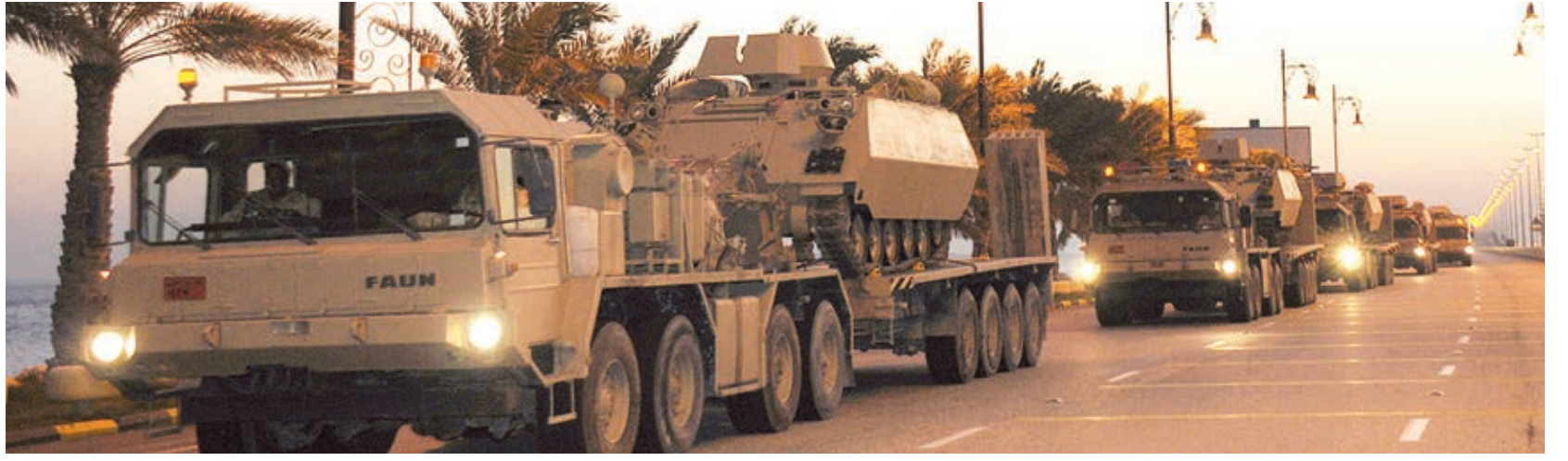
مغادرة مجموعة القتال.